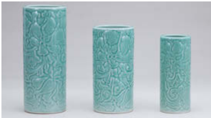
741-101-792 4,600円 741-102-792 4,200円 741-103-792 2,650円 唐草投入尺 唐草投入8.0 唐草投入7.0 (φ12.5×30.5) 1077110179 (φ12.×24.5) 1077110279 (φ9×21.5) 1077110379