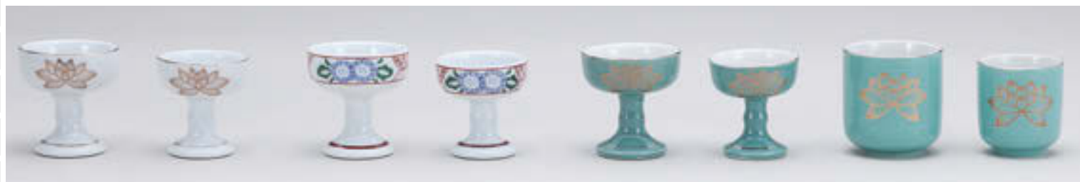
738-501-522 470円 白金蓮大仏器 (5.8×6.2) 25入 1273850152