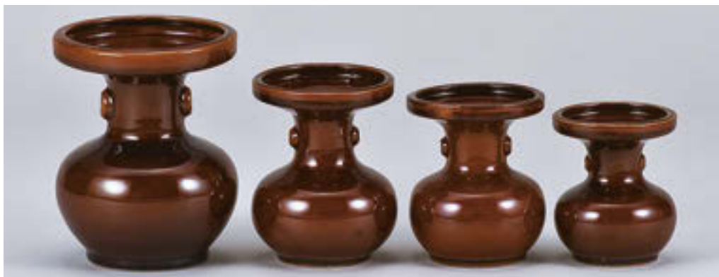
741-501-572 2,250円 741-502-572 1,350円 741-503-572 1,200円 741-504-572 1,100円 松立6寸 松立5寸 松立4.5寸 松立4寸 (14×18) 571740157 (11.5×14.5) 571740257 (11×13) 571740357 (9.5×11.5) 571740457