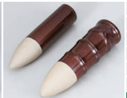
741-505-012 600円 741-506-012 1,100円 野花立(大) 野花立(特大) (6×26) 571750101 (8.5×30) 571750301