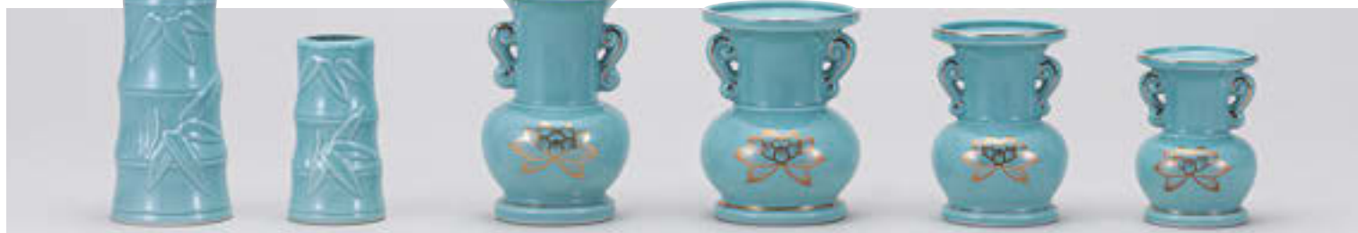
739-101-522 1,000円 青地竹型5.0榊立 (H15) 20入 1273910152