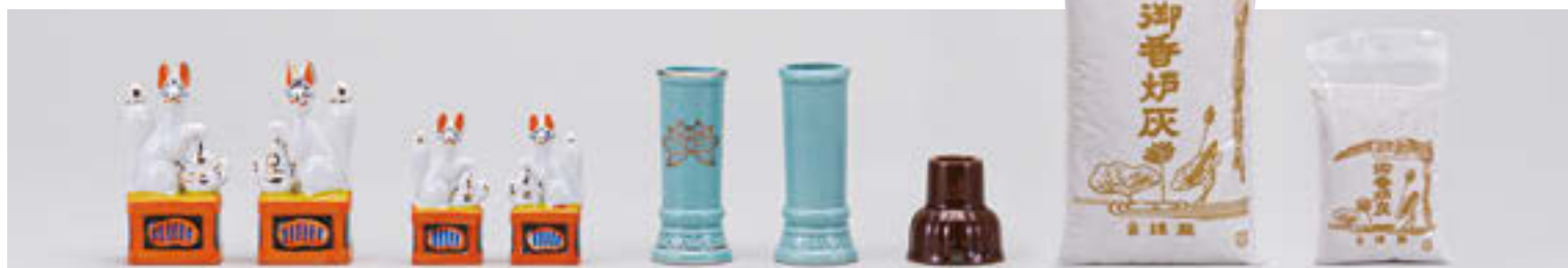
739-401-522 3,150円 錦5.0稻荷(H15) 1273940152