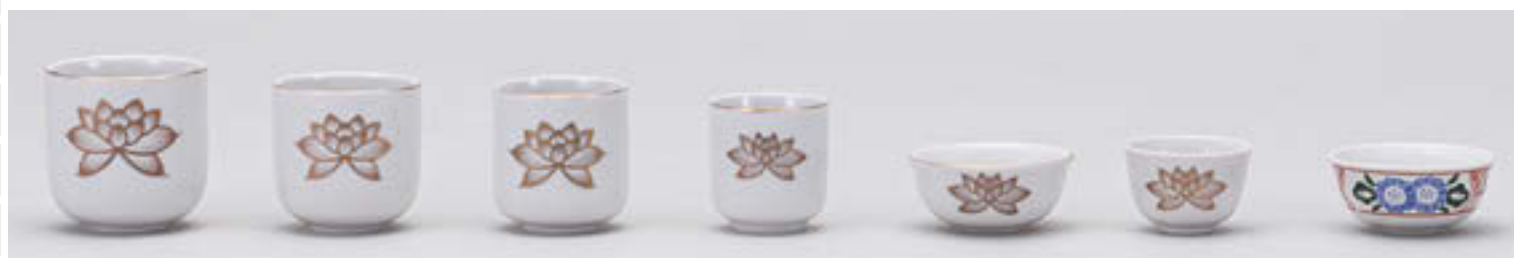
738-401-522 540円 白金蓮2.2湯呑 (6.7×6.8) 20入 1273840152