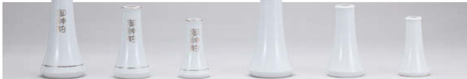
738-101-522 2,000円 御神前6.0榊立 (H18) 8入 1273810152