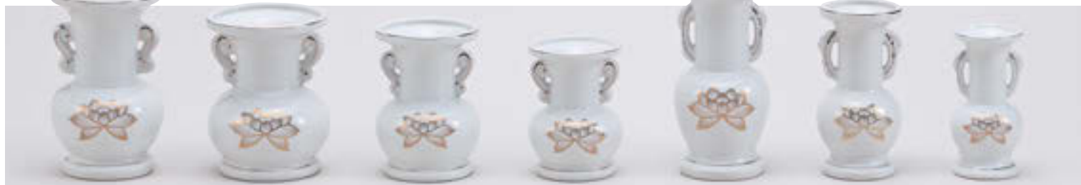
739-201-522 2,460円 白金蓮6.0玉仏花 (H16.5) 6入 1273920152