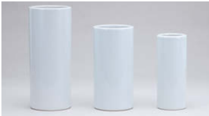
741-201-792 4,600円 741-202-792 4,200円 741-203-792 2,650円 白投入尺 白投入8.0 白投入7.0 (φ12.5×30.5) 1077120179 (φ12.×24.5) 1077120279 (φ9×21.5) 1077120379