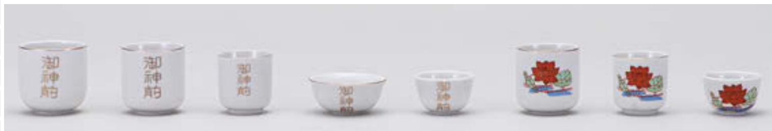
738-301-522 470円 御神前2.0湯呑 (6.1×6) 20入 1273830152