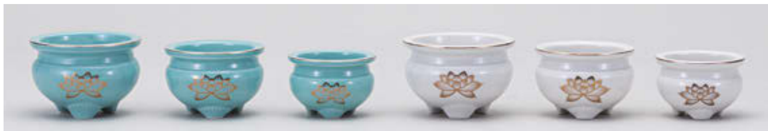
739-301-522 1,400円 青地金蓮4.0香炉 (H11.5) 1273930152