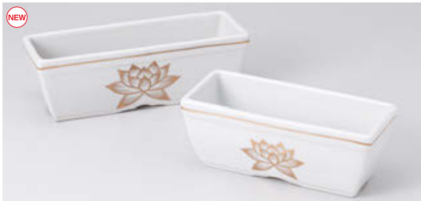
741-401-702 2,500円 741-402-702 2,200円 金ハス長角香炉6.0 金ハス長角香炉5.0 (19.3×7×6.2) 1274140170 (16.2×9×6.2) 1274140270