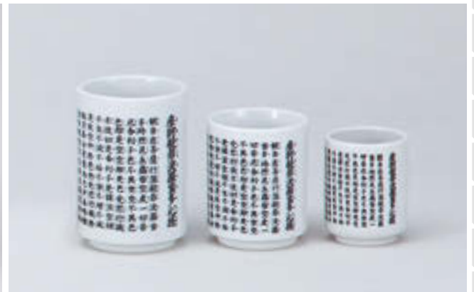
741-403-572 740円 741-404-572 530円 741-405-572 370円 心経湯呑(大) 心経湯呑(小) 心経湯呑(ミニ) (7.2×10.3) 772250857 (6.5×8) 772250957 (5.5×6.8) 772251057