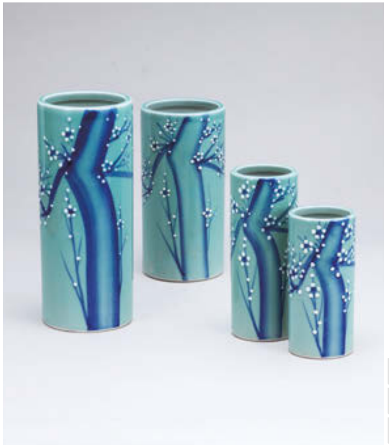
741-301-792 4,900円 741-302-792 4,600円 741-303-792 2,900円 741-304-792 2,750円 梅投入尺 梅投入8.0 梅投入れ7.0 梅投入れ6.0 (φ12.5×30.3) 1077130179 (φ12×24.8) 1077130279 (φ8.5×22) 1077130379 (φ8.5×18) 1077130479