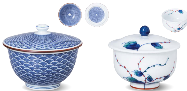
363-101-903 4,000円 青海波紋 汲出 (9.6×7.8・180cc)