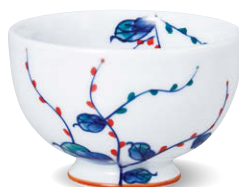
363-402-903 1,250円 水引草 千茶 (7.5×5・130cc)