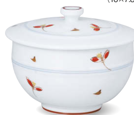
363-301-903 1,700円 あかね草 汲出 (8.5×7.5・200cc)