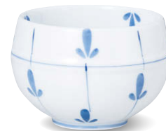
363-504-903 780円 めばえ つぼ千茶 (7.4×5.6・200cc)