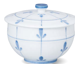
363-302-903 1,700円 めばえ 汲出 (8.5×7.5・200cc)