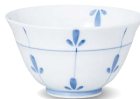
363-503-903 780円 めばえ 反千茶 (9.7×5.6・200cc)