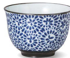
363-603-903 950円 唐草地紋 千茶 (8×5.3・160cc)