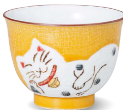
363-602-903 1,400円 招福ネコ 千茶 (8.3×5.8・150cc)