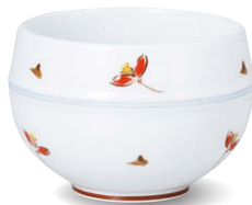
363-502-903 780円 あかね草 つぼ千茶 (7.5×5.6・200cc)