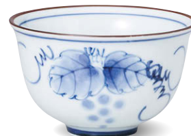
363-403-903 1,100円 古染ぶどう 反千茶 (9.2×5.7・200cc)