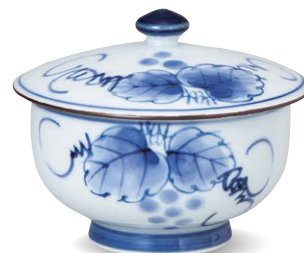
363-201-903 2,100円 古染ぶどう 汲出 (10×7.8・190cc)