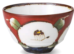
363-601-903 2,300円 濃椿 小千茶 (7×4.4・70cc)