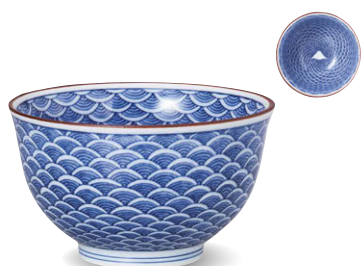
363-401-903 2,350円 青海波紋 京千茶 (9×5.3・180cc)