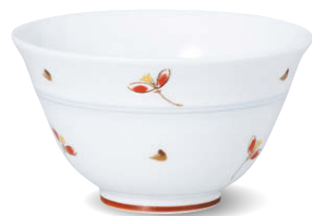
363-501-903 780円 あかね草 反千茶 (9.7×5.6・200cc)